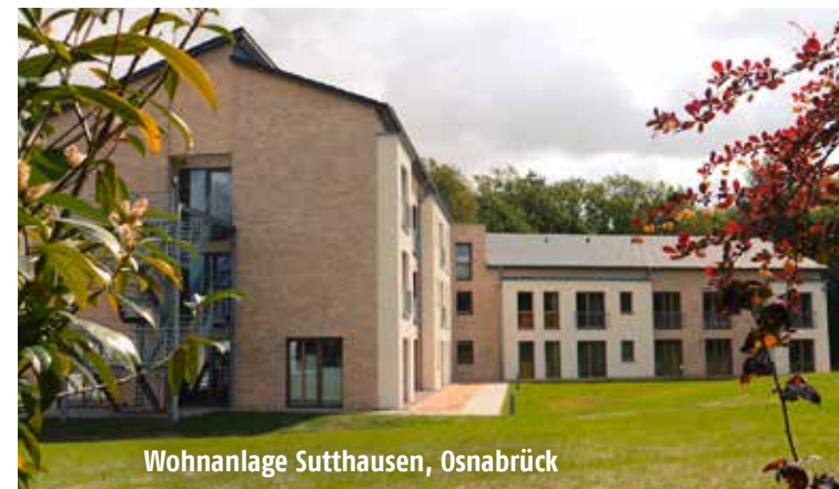
Wohnanlage Sutthausen, Osnabrück

LAGE: Der Neubau wurde 2019 nach modernsten Erkenntnissen und einer energetischen Bauweise errichtet und liegt idyllisch im Süden der Stadt Osnabrück im Stadtteil Sutthausen nahe dem Teutoburger Wald mit schönen Spazier- und Laufwegen. Einkaufsmöglichkeiten, Restaurants, Ärzte, etc. sind mit dem Rad oder zu Fuß im Stadtteil gut zu erreichen. Eine Stadtbuslinie verbindet Sutthausen mit dem Zentrum von Osnabrück.