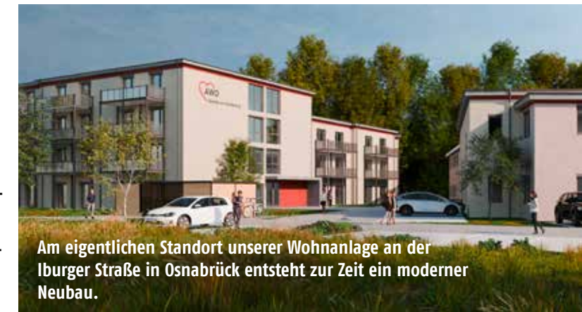
Am eigentlichen Standort unserer Wohnanlage an der Iburger Straße in Osnabrück entsteht zur Zeit ein moderner Neubau.

brück. Einkaufsmöglichkeiten, Restaurants, Ärzte, etc. sind mit dem Rad oder zu Fuß gut zu erreichen. In unmittelbarer Nähe gibt es Möglichkeiten für sportliche und andere Freizeitgestaltungen. Zur nächst größeren Stadt Osnabrück (ca. 10 km) besteht eine gute Verkehrsanbindung per Bus oder Bahn.